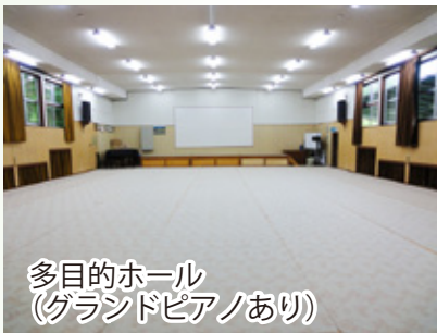
多目的ホール (グランドピアノあり)