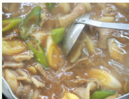
2年以上寝かせた味噌で作る味噌鍋も人気。

お客様から好評を頂いている鍋料理。味の秘訣はお出汁にあります。お出汁が美味しいから、素材も活かされ、食べ飽きない。自慢の鍋料理をお召し上がり下さい。