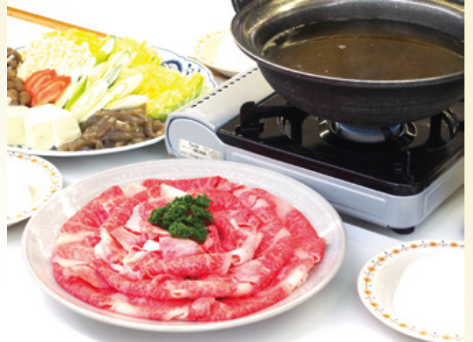
黒毛和牛しゃぶしゃぶ すきやき・焼き肉