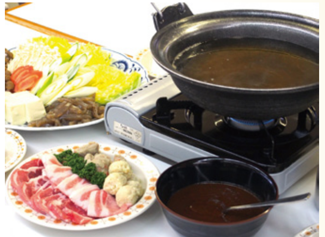
お出汁で寄せ鍋 味噌で味噌鍋